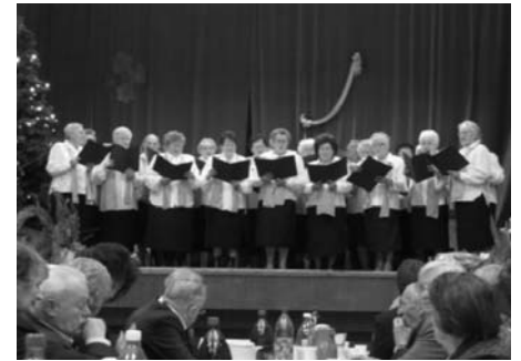
Weihnachtsfeier 2004 in Schneidemühl

allem Gesundheit sowie Gottes Segen und viel Glück bei allen Beschlüssen für Stadt und Land Cuxhaven.